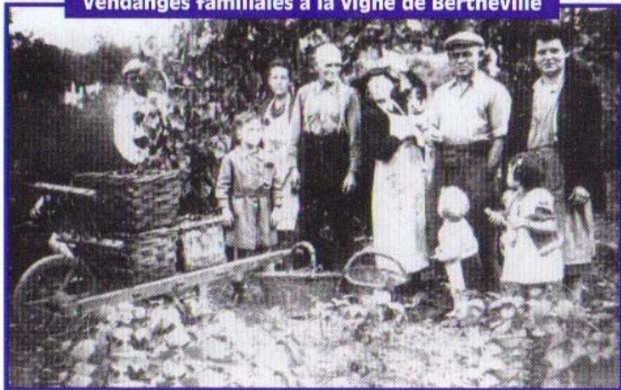
Vendanges familiales à la vigne de Bertheville

A partir du XVIème siècle, les goûts changent et l'on consomme du vin rouge "Clairat", synonyme de force. Le vin consommé au détail était imposé. A ces impôts de consommateurs du XIVème siècle s'y ajoutait un impôt spécial dit "droit d'entrée" ou